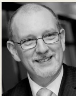
MUDr. Miroslav Palát, MBA prezident Česká asociace dodavatelů zdravotnických prostředků