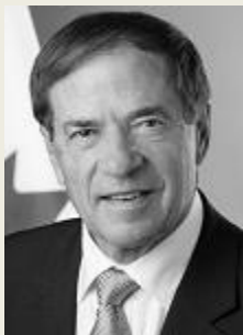
p. Otto Jelinek velvyslanec Velvyslanectví Kanady v České republice