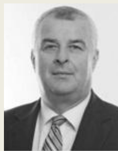
PharmDr. Zdeněk Blahuta ředitel Státní ústav pro kontrolu léčiv