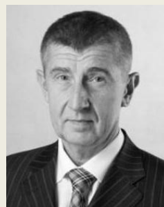
Ing. Andrej Babiš 1. místopředseda vlády ministr financí Ministerstvo financí ČR