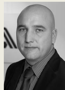
Ing. Zdeněk Kabátek generální ředitel Všeobecná zdravotní pojišťovna České republiky