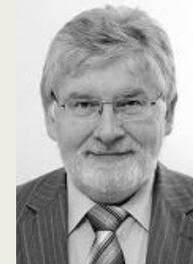
MUDr. Martin Holcát, MBA ministr zdravotnictví v letech 2013 – 2014 Ministerstvo zdravotnictví ČR