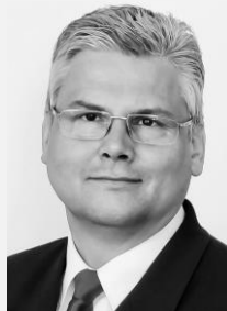
JUDr. Ing. Miloslav Ludvík, MBA ministr zdravotnictví Ministerstvo zdravotnictví České republiky