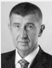
Ing. Andrej Babiš 1. místopředseda vlády ministr financí Ministerstvo financí České republiky