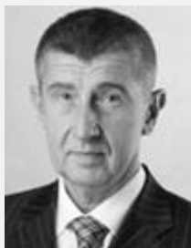
Ing. Andrej Babiš 1. místopředseda vlády ministr financí Ministerstvo financí České republiky