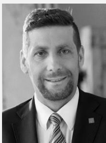
Ing. Radek Lacko radní pro oblast zdravotnictví a bydlení Hlavní město Praha