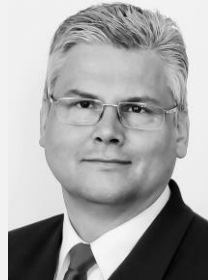
JUDr. Ing. Miloslav Ludvík, MBA ministr zdravotnictví Ministerstvo zdravotnictví České republiky