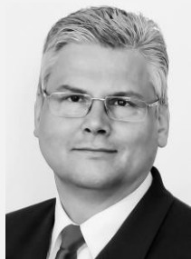
JUDr. Ing. Miloslav Ludvík, MBA ministr zdravotnictví Ministerstvo zdravotnictví České republiky