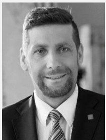
Ing. Radek Lacko radní pro oblast zdravotnictví a bydlení Hlavní město Praha