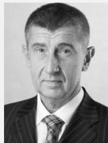
Ing. Andrej Babiš ministr financí v letech 2014 - 2017 Ministerstvo financí České republiky