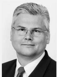
JUDr. Ing. Miloslav Ludvík, MBA ministr zdravotnictví Ministerstvo zdravotnictví České republiky