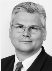
JUDr. Ing. Miloslav Ludvík, MBA ministr zdravotnictví Ministerstvo zdravotnictví České republiky