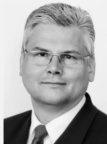
JUDr. Ing. Miloslav Ludvík, MBA ministr zdravotnictví Ministerstvo zdravotnictví České republiky