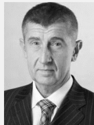
Ing. Andrej Babiš ministr financí v letech 2014 - 2017 Ministerstvo financí České republiky