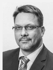
Mgr. Michal Mariánek náměstek primátora město Ostrava