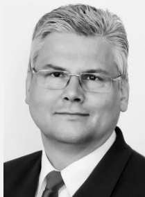
JUDr. Ing. Miloslav Ludvík, MBA ministr zdravotnictví Ministerstvo zdravotnictví České republiky