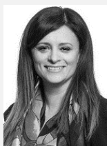
Ing. Jaroslava Pokorná Jermanová hejtmanka Středočeský kraj