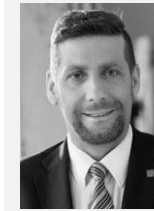
Ing. Radek Lacko radní pro oblast zdravotnictví a bydlení Hlavní město Praha