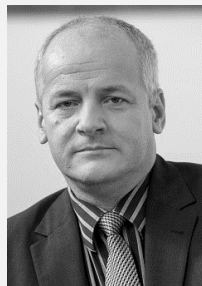
prof. MUDr. Roman Prymula, CSc., Ph.D. náměstek ministra pro zdravotní péči Ministerstvo zdravotnictví České republiky