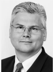
JUDr. Ing. Miloslav Ludvík, MBA ministr zdravotnictví Ministerstvo zdravotnictví České republiky