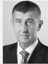
Ing. Andrej Babiš ministr financí v letech 2014 - 2017 Ministerstvo financí České republiky