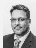
Mgr. Michal Mariánek náměstek primátora město Ostrava