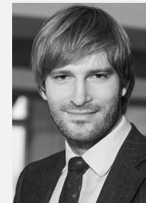
Mgr. et Mgr. Adam Vojtěch poslanec, expert pro oblast zdravotnictví Poslanecká sněmovna Parlamentu České republiky