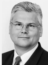
JUDr. Ing. Miloslav Ludvík, MBA ministr zdravotnictví Ministerstvo zdravotnictví České republiky