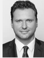
Mgr. Radek Vondráček předseda, Poslanecká sněmovna Parlamentu České republiky