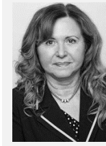
prof. MUDr. Věra Adámková, CSc. předsedkyně, Výbor pro zdravotnictví - Poslanecká sněmovna Parlamentu ČR