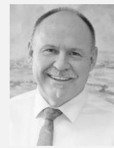
Ladislav Okleštěk hejtman, Olomoucký kraj