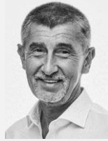
Ing. Andrej Babiš premiér, Vláda České republiky