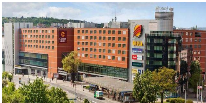
Clarion Congress Hotel Prague**** Freyova 33 190 00 Praha Česká republika Souřadnice: 50°6'38.627"N, 14°30'7.154"E