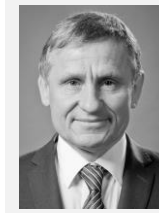
Jiří Čunek hejtman, Zlínský kraj