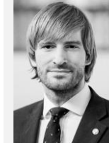
Mgr. et Mgr. Adam Vojtěch, MHA ministr, Ministerství České republiky zdravotnictví České republiky