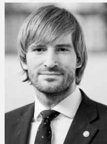
Mgr. et Mgr. Adam Vojtěch, MHA ministr, Ministerstvo zdravotnictví České republiky