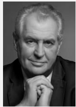
Ing. Miloš Zeman, dr. h. c. prezident, Česká republika