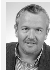
MUDr. Petr Šonka předseda, Sdružení praktických lékařů České republiky