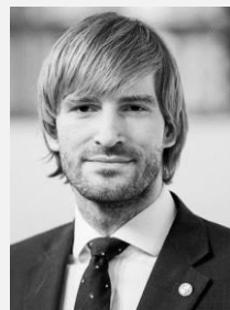
Mgr. et Mgr. Adam Vojtěch, MHA ministr, Ministerstvo zdravotnictví České republiky