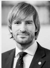
Mgr. et Mgr. Adam Vojtěch, MHA ministr, Ministerstvo zdravotnictví České republiky