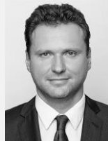
Mgr. Radek Vondráček předseda, Poslanecká sněmovna Parlamentu České republiky