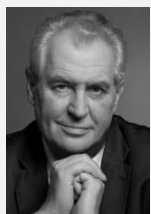
Ing. Miloš Zeman, dr. h. c. prezident, Česká republika