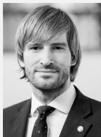
Mgr. et Mgr. Adam Vojtěch, MHA ministr, Ministerstvo zdravotnictví České republiky