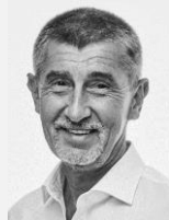
Ing. Andrej Babiš premiér, Vláda České republiky