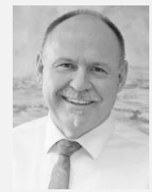
Ladislav Okleštěk hejtman, Olomoucký kraj