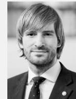
Mgr. et Mgr. Adam Vojtěch, MHA ministr, Ministerstvo zdravotnictví České republiky