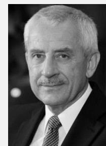
doc. MUDr. Leoš Heger, CSc. ministr zdravotnictví v letech 2010 – 2013, Ministerstvo zdravotnictví České republiky