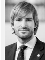
Mgr. et Mgr. Adam Vojtěch ministr, Ministerstvo zdravotnictví České republiky