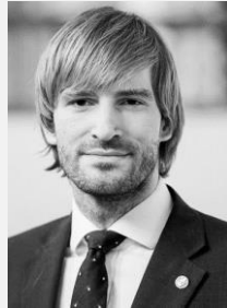
Mgr. et Mgr. Adam Vojtěch ministr, Ministerstvo zdravotnictví České republiky