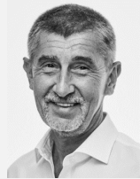
Ing. Andrej Babiš premiér, Vláda České republiky