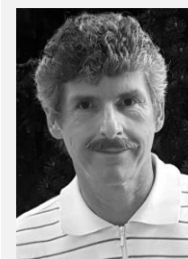
Mgr. Vlastimil Milata předseda, Patientská rada Ministerstva zdravotnictví České republiky