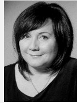
JUDr. Alena Schillerová, Ph.D. ministryně, Ministerstvo financí České republiky