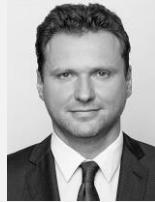
Mgr. Radek Vondráček předseda, Poslanecká sněmovna Parlamentu České republiky