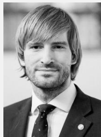
Mgr. et Mgr. Adam Vojtěch ministr, Ministerstvo zdravotnictví České republiky