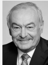
MUDr. Přemysl Sobotka náměstek hejtmána, Liberecký kraj