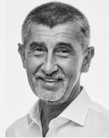
Ing. Andrej Babiš premiér, Vláda České republiky