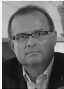
PharmDr. Lubomír Chudoba prezident, Česká lékárnická komora