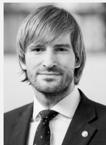
Mgr. et Mgr. Adam Vojtěch, MHA ministr, Ministerstvo zdravotnictví České republiky