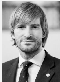
Mgr. et Mgr. Adam Vojtěch, MHA ministr, Ministerstvo zdravotnictví České republiky