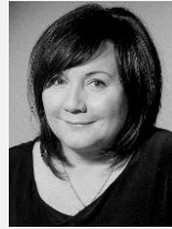
JUDr. Alena Schillerová, Ph.D. ministryně, Ministerstvo financí České republiky