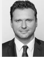
Mgr. Radek Vondráček předseda, Poslanecká sněmovna Parlamentu České republiky