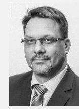
Mgr. Michal Mariánek náměstek primátora, Město Ostrava