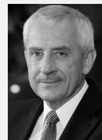
doc. MUDr. Leoš Heger, CSc. ministr zdravotnictví v letech 2010 – 2013