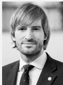
Mgr. et Mgr. Adam Vojtěch ministr, Ministerstvo zdravotnictví České republiky