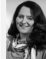
Ing. Jaroslava Němcová, MBA ministryně, Ministerstvo práce a sociálních věcí