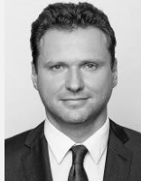
Mgr. Radek Vondráček předseda, Poslanecká sněmovna Parlamentu České republiky