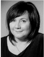
JUDr. Alena Schillerová, Ph.D. ministryně, Ministerstvo financí České republiky