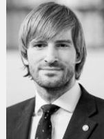
Mgr. et Mgr. Adam Vojtěch ministr, Ministerstvo zdravotnictví České republiky