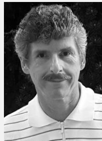
Mgr. Vlastimil Milata předseda, Pacientská rada Ministerstva zdravotnictví České republiky