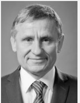
Jiří Čunek hejtman, Zlínský kraj