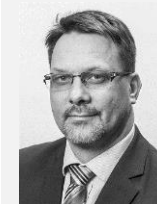
Mgr. Michal Mariánek náměstek primátora, Město Ostrava