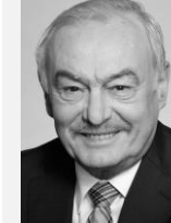
MUDr. Přemysl Sobotka náměstek hejtmana, Liberecký kraj