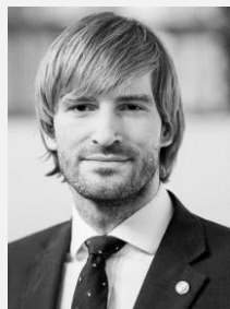
Mgr. et Mgr. Adam Vojtěch ministr, Ministerstvo zdravotnictví České republiky