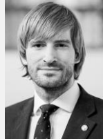
Mgr. et Mgr. Adam Vojtěch ministr, Ministerstvo zdravotnictví České republiky