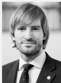
Mgr. et Mgr. Adam Vojtěch ministr, Ministerstvo zdravotnictví České republiky