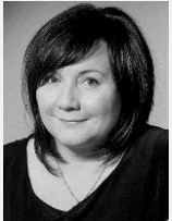
JUDr. Alena Schillerová, Ph.D. ministrýně, Ministerstvo financí České republiky