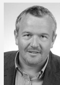
MUDr. Petr Šonka předseda, Sdružení praktických lékařů České republiky