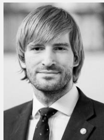
Mgr. et Mgr. Adam Vojtěch ministr, Ministerstvo zdravotnictví České republiky