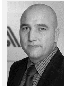
Ing. Zdeněk Kabátek ředitel, Všeobecná zdravotní pojišťovna České republiky