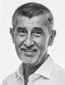
Ing. Andrej Babiš premiér, Vláda České republiky