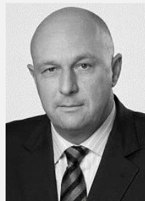
MUDr. Tomáš Julínek, MBA ministr zdravotnictví v letech 2006 – 2009, Ministerstvo zdravotnictví České republiky