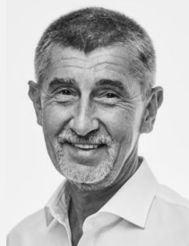
Ing. Andrej Babiš premiér, Vláda České republiky