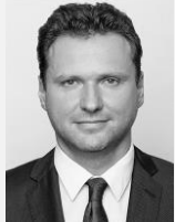
Mgr. Radek Vondráček předseda, Poslanecká sněmovna Parlamentu České republiky