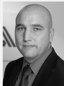
Ing. Zdeněk Kabátek ředitel, Všeobecná zdravotní pojišťovna České republiky