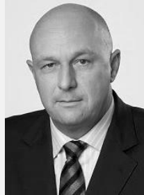
MUDr. Tomáš Julínek, MBA ministr zdravotnictví v letech 2006 – 2009, Ministerstvo zdravotnictví České republiky