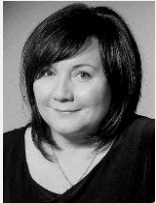
JUDr. Alena Schillerová, Ph.D. ministryně, Ministerstvo financí České republiky