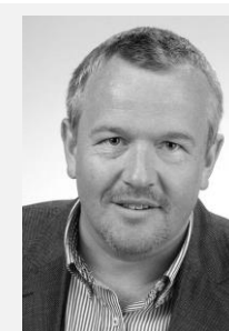
MUDr. Petr Šonka předseda, Sdružení praktických lékařů České republiky