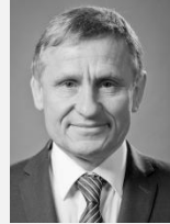
Jiří Čunek hejtman, Zlínský kraj