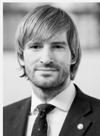
Mgr. et Mgr. Adam Vojtěch, MHA ministr, Ministerstvo zdravotnictví České republiky