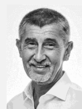
Ing. Andrej Babiš premiér, Vláda České republiky