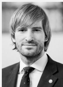
Mgr. et Mgr. Adam Vojtěch, MHA ministr, Ministerstvo zdravotnictví České republiky