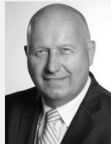
Oldřich Bubeníček hejtman, Ústecký kraj