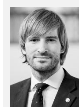
Mgr. et Mgr. Adam Vojtěch, MHA ministr, Ministerstvo zdravotnictví České republiky