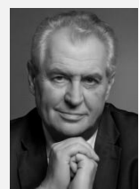
Ing. Miloš Zeman, dr. h. c. prezident, Česká republika