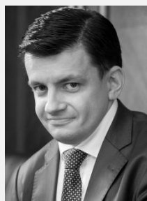
Mgr. Filip Vrubel náměstek ministra, Ministerstvo zdravotnictví České republiky

Účast v diskusním bloku prozatím potvrdili: