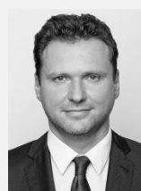
Mgr. Radek Vondráček předseda, Poslanecká sněmovna Parlamentu České republiky