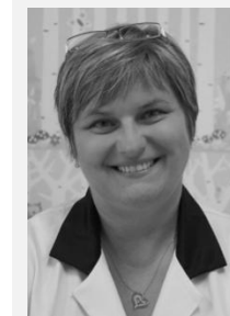
MUDr. Ilona Hülleová předsedkyně, Sdružení praktických lékařů pro děti a dorost České republiky