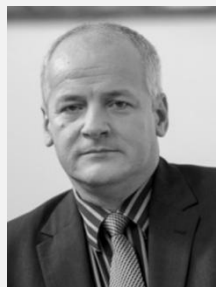
Prof. MUDr. Roman Prymula, CSc., Ph.D. náměstek pro zdravotní péči, Ministerstvo zdravotnictví České republiky