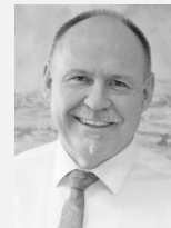
Ladislav Okleštěk hejtman, Olomoucký kraj