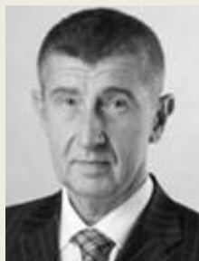
Ing. Andrej Babiš 1. místopředseda vlády ministr financí Ministerstvo financí České republiky