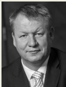
MUDr. Svatopluk Němeček, MBA ministr zdravotnictví Ministerstvo zdravotnictví České republiky