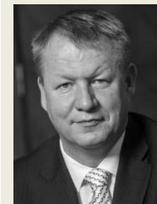
MUDr. Svatopluk Němeček, MBA ministr zdravotnictví Ministerstvo zdravotnictví České republiky