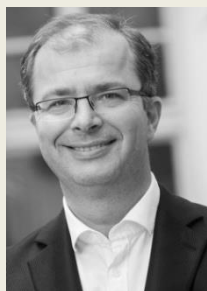
MUDr. Tom Philipp, Ph.D., MBA náměstek ministra pro zdravotní pojištění Ministerstvo zdravotnictví České republiky