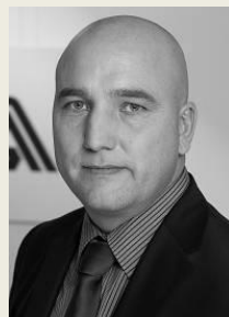
Ing. Zdeněk Kabátek generální ředitel Všeobecná zdravotní pojišťovna České republiky