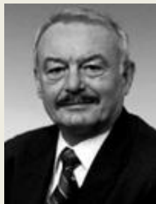
MUDr. Přemysl Sobotka 1. místopředseda Senát Parlamentu ČR