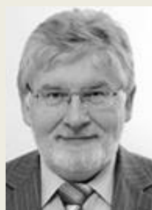
MUDr. Martin Holcát, MBA náměstek pro léčebně preventivní péči Fakultní nemocnice v Motole ministr zdravotnictví v letech 2013 – 2014