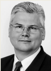
JUDr. Ing. Miloslav Ludvík, MBA ředitel Fakultní nemocnice v Motole