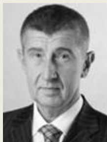
Ing. Andrej Babiš 1. místopředseda vlády ministr financí Ministerstvo financí České republiky