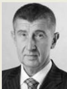
Ing. Andrej Babiš 1. místopředseda vlády ministr financí Ministerstvo financí České republiky