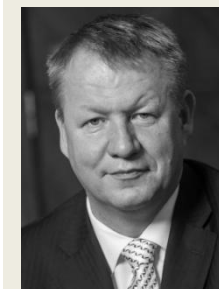
MUDr. Svatopluk Němeček, MBA ministr zdravotnictví Ministerstvo zdravotnictví České republiky