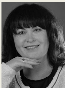
Mgr. Soňa Marková místopředsedkyně Výboru pro zdravotnictví Poslanecká sněmovna Parlamentu České republiky