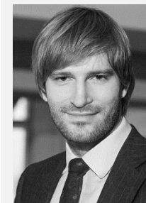
Mgr. et Mgr. Adam Vojtěch poslanec, expert pro oblast zdravotnictví Poslanecká sněmovna Parlamentu České republiky