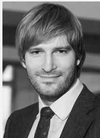
Mgr. et Mgr. Adam Vojtěch poslanec, expert pro oblast zdravotnictví Poslanecká sněmovna Parlamentu České republiky