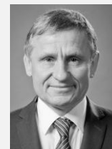
Jiří Čunek předseda komise pro zdravotnictví Asociace krajů České republiky