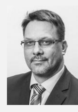
Mgr. Michal Mariánek náměstek primátora město Ostrava