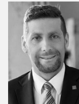
Ing. Radek Lacko radní pro oblast zdravotnictví a bydlení Hlavní město Praha