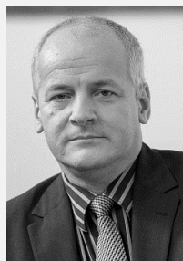
prof. MUDr. Roman Prymula, CSc., Ph.D. náměstek ministra pro zdravotní péči Ministerstvo zdravotnictví České republiky