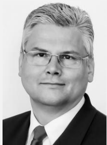
JUDr. Ing. Miloslav Ludvík, MBA ministr zdravotnictví Ministerstvo zdravotnictví České republiky