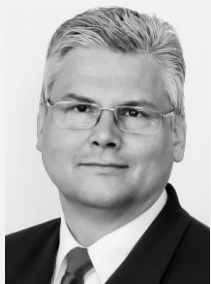
JUDr. Ing. Miloslav Ludvík, MBA ministr zdravotnictví Ministerstvo zdravotnictví České republiky