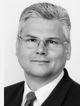
JUDr. Ing. Miloslav Ludvík, MBA ministr zdravotnictví Ministerstvo zdravotnictví České republiky