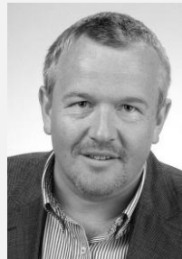
MUDr. Petr Šonka předseda Sdružení praktických lékařů České republiky