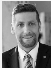
Ing. Radek Lacko radní pro oblast zdravotnictví a bydlení Hlavní město Praha