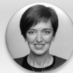
MUDr. Zdenka Němečková Crkvenjaš, MBA předsedkyně, Výbor pro zdravotnictví – Poslanecká sněmovna Parlamentu České republiky