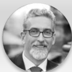
Mgr. Miroslav Žbánek, MPA primátor, statutární město Olomouc