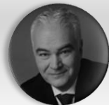
MUDr. Kamal Farhan stínový ministr zdravotnictví, poslanec, člen Výboru pro zdravotnictví, Poslanecká sněmovna Parlamentu České republiky