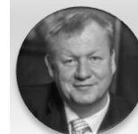
MUDr. Svatopluk Němeček, MBA ministr zdravotnictví v letech 2014 – 2016, Ministerstvo zdravotnictví České republiky; předseda představenstva, Bohumínská městská nemocnice, a.s.