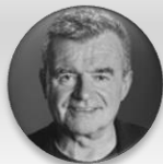
MUDr. Roman Kraus, MBA předseda Výboru pro zdravotnictví, Senát Parlamentu České republiky