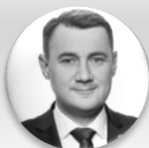
Bc. Martin Půta hejtman, Liberecký kraj

ÚTERÝ 26. 11. 2024, STŘEDA 27. 11. 2024 – CLARION CONGRESS HOTEL PRAGUE – VYSOČANY