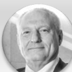
Ing. Zbyněk Pražák, Ph.D. náměstek primátora, statutární město Ostrava