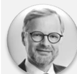
prof. PhDr. Petr Fiala, Ph.D., LL.M. premiér, Vláda České republiky