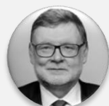
Ing. Zbyněk Stanjura ministr, Ministerstvo financí České republiky; 1. místopředseda, Občanská demokratická strana