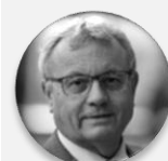
Ing. Vladimír Dlouhý, CSc. emeritní prezident, Hospodářská komora České republiky