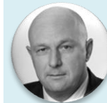
MUDr. Tomáš Julínek, MBA ministr zdravotnictví v letech 2006 – 2009, Ministerstvo zdravotnictví České republiky