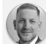
Rudolf Špoták hejtman, Plzeňský kraj