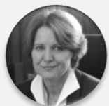
Ing. Helena Rögnerová vrchní ředitelka pro ekonomiku a zdravotní pojištění, Ministerstvo zdravotnictví České republiky