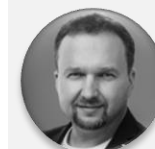
Ing. Marian Jurečka místopředseda vlády, Vláda České republiky; ministr, Ministerstvo práce a sociálních věcí České republiky