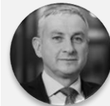
Ing. Jozef Síkela ministr, Ministerstvo průmyslu a obchodu České republiky