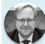
Mgr. Jakub Dvořáček, MHA, LL.M. náměstek ministra, Ministerstvo zdravotnictví České republiky