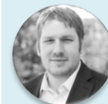
Bc. Josef Pavlovic náměstek ministra, Ministerstvo zdravotnictví České republiky