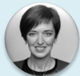
MUDr. Zdenka Němečková Crkvenjaš, MBA předsedkyně, Výbor pro zdravotnictví – Poslanecká sněmovna Parlamentu České republiky