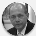
Ing. Petr Kulhánek hejtman, Karlovarský kraj

ÚTERÝ 28. 11. 2023, STŘEDA 29. 11. 2023 – CLARION CONGRESS HOTEL PRAGUE – VYSOČANY