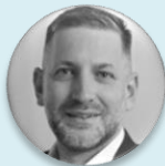
Rudolf Špoták hejtman, Plzeňský kraj