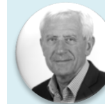
doc. MUDr. Leoš Heger, CSc. ministr zdravotnictví v letech 2010 – 2013, Ministerstvo zdravotnictví České republiky