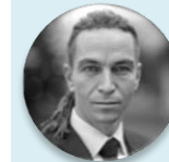
PhDr. Ivan Bartoš, Ph.D. ministr, Ministerstvo pro místní rozvoj České republiky