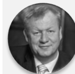
MUDr. Svatopluk Němeček, MBA ministr zdravotnictví v letech 2014 – 2016, Ministerstvo zdravotnictví České republiky; předseda představenstva, Bohumínská městská nemocnice, a.s.