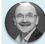
Ing. Pavel Pavlík statutární náměstek hejtmanky pro oblast zdravotnictví, Středočeský kraj