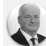
prof. MUDr. Roman Prymula, CSc., Ph.D. ministr zdravotnictví v roce 2020, Ministerstvo zdravotnictví České republiky