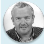
MUDr. Petr Šonka předseda, Sdružení praktických lékařů České republiky