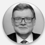
Ing. Zbyněk Stanjura ministr, Ministerstvo financí České republiky; 1. místopředseda, Občanská demokratická strana