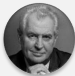
Ing. Miloš Zeman, dr. h. c. prezident, Česká republika

ÚTERÝ 29. 11. 2022, STŘEDA 30. 11. 2022 – CLARION CONGRESS HOTEL PRAGUE – VYSOČANY