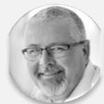
MUDr. Martin Gebauer náměstek hejtmana, Moravskoslezský kraj

ÚTERÝ 29. 11. 2022, STŘEDA 30. 11. 2022 – CLARION CONGRESS HOTEL PRAGUE – VYSOČANY