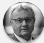
Ing. Vladimír Dlouhý, CSc. prezident, Hospodářská komora České republiky