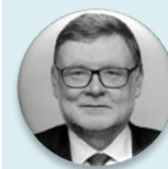
Ing. Zbyněk Stanjura ministr, Ministerstvo financí České republiky; 1. místopředseda, Občanská demokratická strana