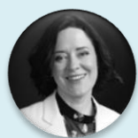
Renate Strazdina evropská ředitelka, oblast zdravotnictví ve společnosti Microsoft