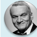
doc. MUDr. Bohuslav Svoboda, CSc. předseda, Výbor pro zdravotnictví – PSP ČR, koordinátor program. týmu zdravotnictví, Občanská demokratická strana