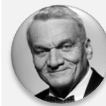
doc. MUDr. Bohuslav Svoboda, CSc. předseda, Výbor pro zdravotnictví – PSP ČR, koordinátor program. týmu zdravotnictví, Občanská demokratická strana