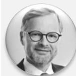
prof. PhDr. Petr Fiala, Ph.D., LL.M. premiér, Vláda České republiky