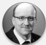
Mgr. Aleš Krebs, PhD. prezident, Česká lékárnická komora

ÚTERÝ 29. 11. 2022, STŘEDA 30. 11. 2022 – CLARION CONGRESS HOTEL PRAGUE – VYSOČANY