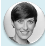
Ing. Markéta Pekarová Adamová předsedkyně, Poslanecká sněmovna Parlamentu České republiky