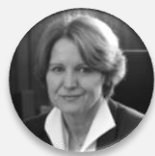
Ing. Helena Rögnerová náměstkyně pro ekonomiku a zdravotní pojištění, Ministerstvo zdravotnictví České republiky