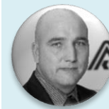
Ing. Zdeněk Kabátek ředitel, Všeobecná zdravotní pojišťovna České republiky