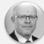
prof. MUDr. Vlastimil Válek, CSc., MBA, EBIR místopředseda vlády, Vláda České republiky; ministr, Ministerstvo zdravotnictví České republiky