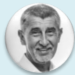
Ing. Andrej Babiš poslanec, Poslanecká sněmovna Parlamentu České republiky; předseda, hnutí ANO