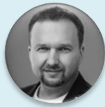
Ing. Marian Jurečka místopředseda vlády, Vláda České republiky; ministr, Ministerstvo práce a sociálních věcí České republiky