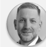
Rudolf Špoták hejtman, Plzeňský kraj