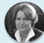
Ing. Helena Rögnerová náměstkyně pro ekonomiku a zdravotní pojištění, Ministerstvo zdravotnictví České republiky