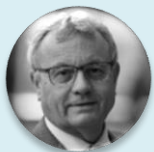
Ing. Vladimír Dlouhý, CSc. prezident, Hospodářská komora České republiky