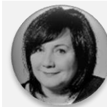
JUDr. Alena Schillerová, Ph.D. místopředsedkyně vlády, Vláda České republiky; ministryně, Ministerstvo financí České republiky