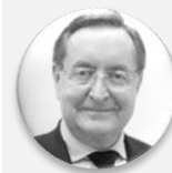
prof. MUDr. Petr Arenberger, DrSc., MBA ministr do roku 2021, Ministerstvo zdravotnictví České republiky