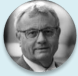
Ing. Vladimír Dlouhý, CSc. prezident, Hospodářská komora České republiky