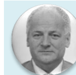
prof. MUDr. Roman Prymula, CSc., Ph.D. předseda představenstva, Nemocnice AGEL Říčany a.s.