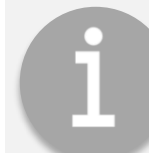
ÚČASTNÍK DISKUSE BYL OSLOVEN