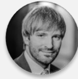
Mgr. et Mgr. Adam Vojtěch, MHA ministr, Ministerstvo zdravotnictví České republiky