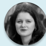
Dipl.-Pol. Jana Maláčová, MSc. ministryně, Ministerstvo práce a sociálních věcí České republiky