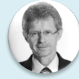
RNDr. Miloš Vystrčil předseda, Senát Parlamentu České republiky