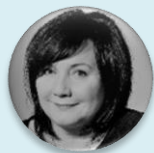
JUDr. Alena Schillerová, Ph.D. místopředsedkyně vlády, Vláda České republiky; ministryně, Ministerstvo financí České republiky