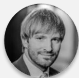
Mgr. et Mgr. Adam Vojtěch, MHA ministr, Ministerstvo zdravotnictví České republiky