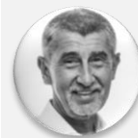
Ing. Andrej Babiš premiér, Vláda České republiky