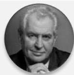
Ing. Miloš Zeman, dr. h. c. prezident, Česká republika

ÚTERÝ 23.11.2021, STŘEDA 24.11.2021 – CLARION CONGRESS HOTEL PRAGUE – VYSOČANY