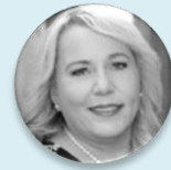
Ing. Klára Dostálová ministryně, Ministerstvo pro místní rozvoj České republiky