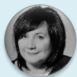
JUDr. Alena Schillerová, Ph.D. místopředsedkyně vlády, Vláda České republiky; ministryně, Ministerstvo financí České republiky