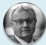
Ing. Vladimír Dlouhý, CSc. prezident, Hospodářská komora České republiky