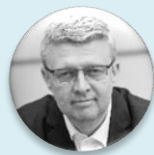
doc. Ing. Karel Havlíček, Ph.D., MBA místopředseda vlády, Vláda České republiky; ministr, Ministerstvo průmyslu a obchodu České republiky