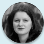
Dipl.-Pol. Jana Maláčová, MSc. ministryně, Ministerstvo práce a sociálních věcí České republiky