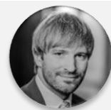
Mgr. et Mgr. Adam Vojtěch, MHA ministr, Ministerstvo zdravotnictví České republiky