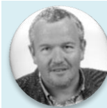
MUDr. Petr Šonka předseda, Sdružení praktických lékařů České republiky