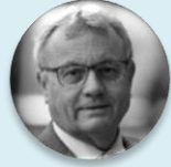
Ing. Vladimír Dlouhý, CSc. prezident, Hospodářská komora České republiky