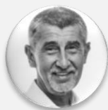
Ing. Andrej Babiš premiér, Vláda České republiky