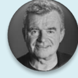
MUDr. Roman Kraus, MBA předseda Výboru pro zdravotnictví, Senát Parlamentu České republiky