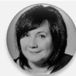
JUDr. Alena Schillerová, Ph.D. místopředsedkyně vlády, Vláda České republiky; ministryně, Ministerstvo financí České republiky