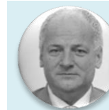
prof. MUDr. Roman Prymula, CSc., Ph.D. předseda představenstva, Nemocnice AGEL Říčany a.s.