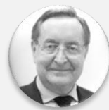
prof. MUDr. Petr Arenberger, DrSc., MBA ministr do roku 2021, Ministerstvo zdravotnictví České republiky