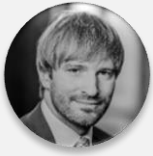
Mgr. et Mgr. Adam Vojtěch, MHA ministr, Ministerstvo zdravotnictví České republiky