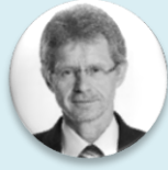
RNDr. Miloš Vystrčil předseda, Senát Parlamentu České republiky