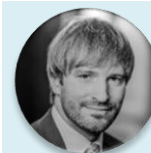
Mgr. et Mgr. Adam Vojtěch, MHA ministr, Ministerstvo zdravotnictví České republiky