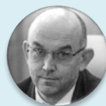
doc. MUDr. Jan Blatný, Ph.D. ministr do roku 2021, Ministerstvo zdravotnictví České republiky