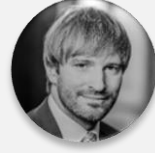
Mgr. et Mgr. Adam Vojtěch, MHA ministr, Ministerstvo zdravotnictví České republiky