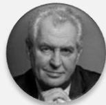
Ing. Miloš Zeman, dr. h. c. prezident, Česká republika

ÚTERÝ 23.11.2021, STŘEDA 24.11.2021 – CLARION CONGRESS HOTEL PRAGUE – VYSOČANY