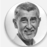
Ing. Andrej Babiš premiér, Vláda České republiky