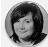
JUDr. Alena Schillerová, Ph.D. místopředsedkyně vlády, Vláda České republiky; ministryně, Ministerstvo financí České republiky