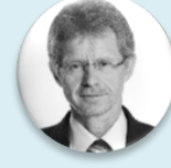
RNDr. Miloš Vystrčil předseda, Senát Parlamentu České republiky