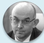
doc. MUDr. Jan Blatný, Ph.D. ministr do roku 2021, Ministerstvo zdravotnictví České republiky