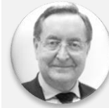
prof. MUDr. Petr Arenberger, DrSc., MBA ministr do roku 2021, Ministerstvo zdravotnictví České republiky