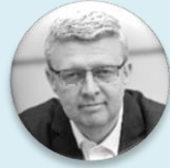
doc. Ing. Karel Havlíček, Ph.D., MBA místopředseda vlády, Vláda České republiky; ministr, Ministerstvo průmyslu a obchodu České republiky