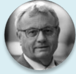
Ing. Vladimír Dlouhý, CSc. prezident, Hospodářská komora České republiky