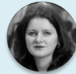
Dipl.-Pol. Jana Maláčová, MSc. ministryně, Ministerstvo práce a sociálních věcí České republiky