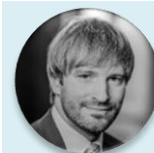
Mgr. et Mgr. Adam Vojtěch, MHA ministr, Ministerstvo zdravotnictví České republiky