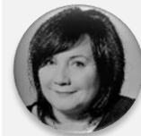
JUDr. Alena Schillerová, Ph.D. místopředsedkyně vlády, Vláda České republiky; ministryně, Ministerstvo financí České republiky