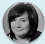
JUDr. Alena Schillerová, Ph.D. místopředsedkyně vlády, Vláda České republiky; ministryně, Ministerstvo financí České republiky