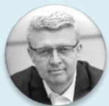
doc. Ing. Karel Havlíček, Ph.D., MBA místopředseda vlády, Vláda České republiky; ministr, Ministerstvo průmyslu a obchodu České republiky