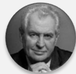
Ing. Miloš Zeman, dr. h. c. prezident, Česká republika

ÚTERÝ 23.11.2021, STŘEDA 24.11.2021 – CLARION CONGRESS HOTEL PRAGUE – VYSOČANY