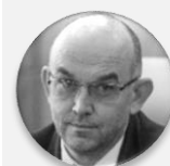
doc. MUDr. Jan Blatný, Ph.D. ministr do roku 2021, Ministerstvo zdravotnictví České republiky