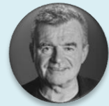
MUDr. Roman Kraus, MBA předseda Výboru pro zdravotnictví, Senát Parlamentu České republiky