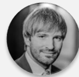
Mgr. et Mgr. Adam Vojtěch, MHA ministr, Ministerstvo zdravotnictví České republiky