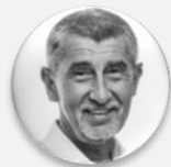
Ing. Andrej Babiš premiér, Vláda České republiky