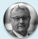
Ing. Vladimír Dlouhý, CSc. prezident, Hospodářská komora České republiky