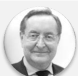
prof. MUDr. Petr Arenberger, DrSc., MBA ministr do roku 2021, Ministerstvo zdravotnictví České republiky