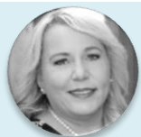
Ing. Klára Dostálová ministryně, Ministerstvo pro místní rozvoj České republiky