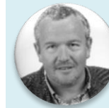
MUDr. Petr Šonka předseda, Sdružení praktických lékařů České republiky