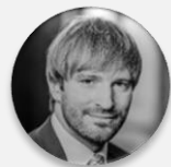
Mgr. et Mgr. Adam Vojtěch, MHA ministr, Ministerstvo zdravotnictví České republiky