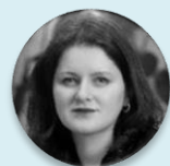
Dipl.-Pol. Jana Maláčová, MSc. ministryně, Ministerstvo práce a sociálních věcí České republiky