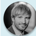
Mgr. et Mgr. Adam Vojtěch, MHA ministr, Ministerstvo zdravotnictví České republiky