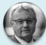
Ing. Vladimír Dlouhý, CSc. prezident, Hospodářská komora České republiky